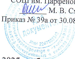
График дежурства администрации в 2024 – 2025 учебном году